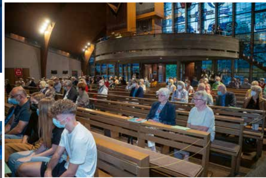
Ein Blick in die Vernissage-Festgemeinde