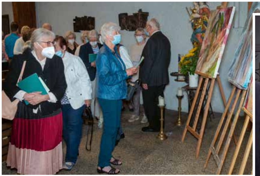
Die Besucher beginnen den Rundgang bei den Exponaten im Altarraum der Kirche