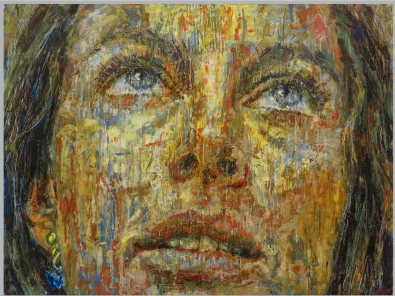
„Gabrielle“ (Größe 89 x 116 cm) - Patrick Marquès - www.marques-peintre.fr

Jesus lebte als historische Gestalt in Galiläa und Judäa, predigte das Reich Gottes, das hereinbrechen werde, war selber das Heil und wurde in einer mythischen Bildersprache als der Bote und Sohn Gottes verstanden. Somit ist Jesus im Himmel und auf Erden verankert, beteiligt an der Schöpfung und wird zum Weltenrichter. Damit wird Jesus zum interessanten und kompetenten Gesprächspartner für uns Menschen, die wir uns mit den Fragen der Entstehung der Welt, dem woher und wohin, dem Sinn des Lebens auf dieser Erde befassen. Durch ihn und in