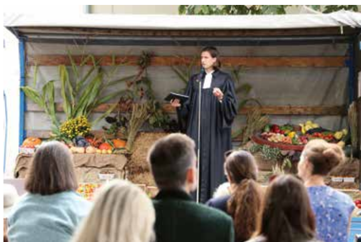
Predigt aus dem Lkw