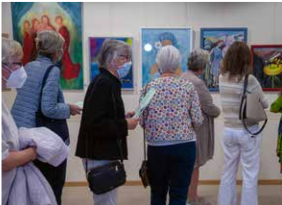
Reges Interesse für die Bilder. Aus Platzgründen können wir Ihnen nur wenige zeigen.