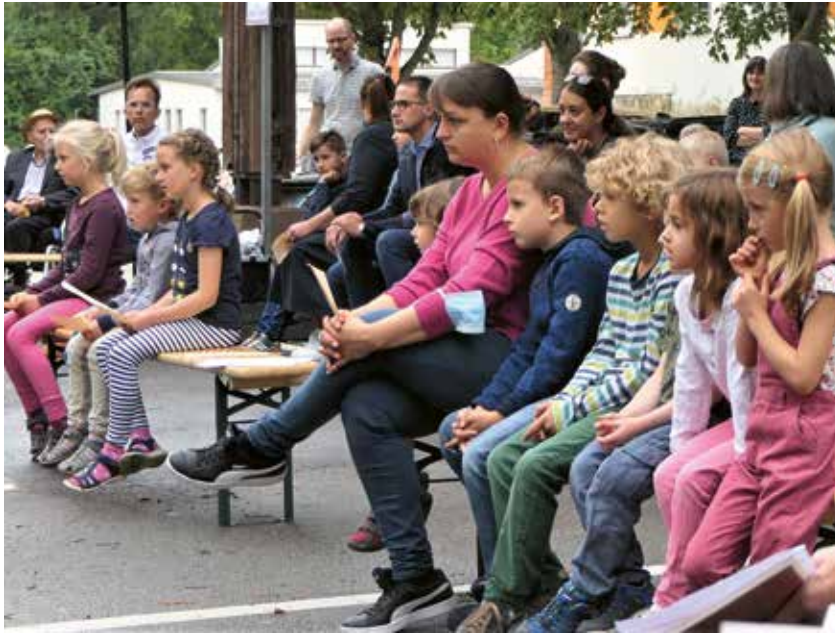
Kindergartenkinder lauschen gespannt der Erzählung

Musikalisch umrahmt wurde der Gottesdienst vom Kirchen- und Posaunenchor.