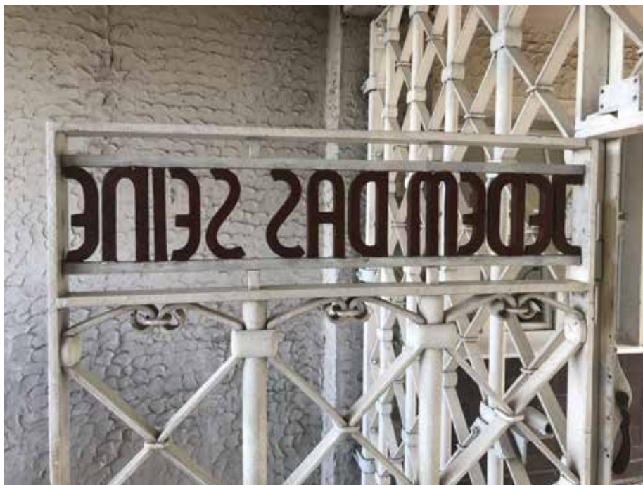
Die Verhöhnung der Menschenwürde