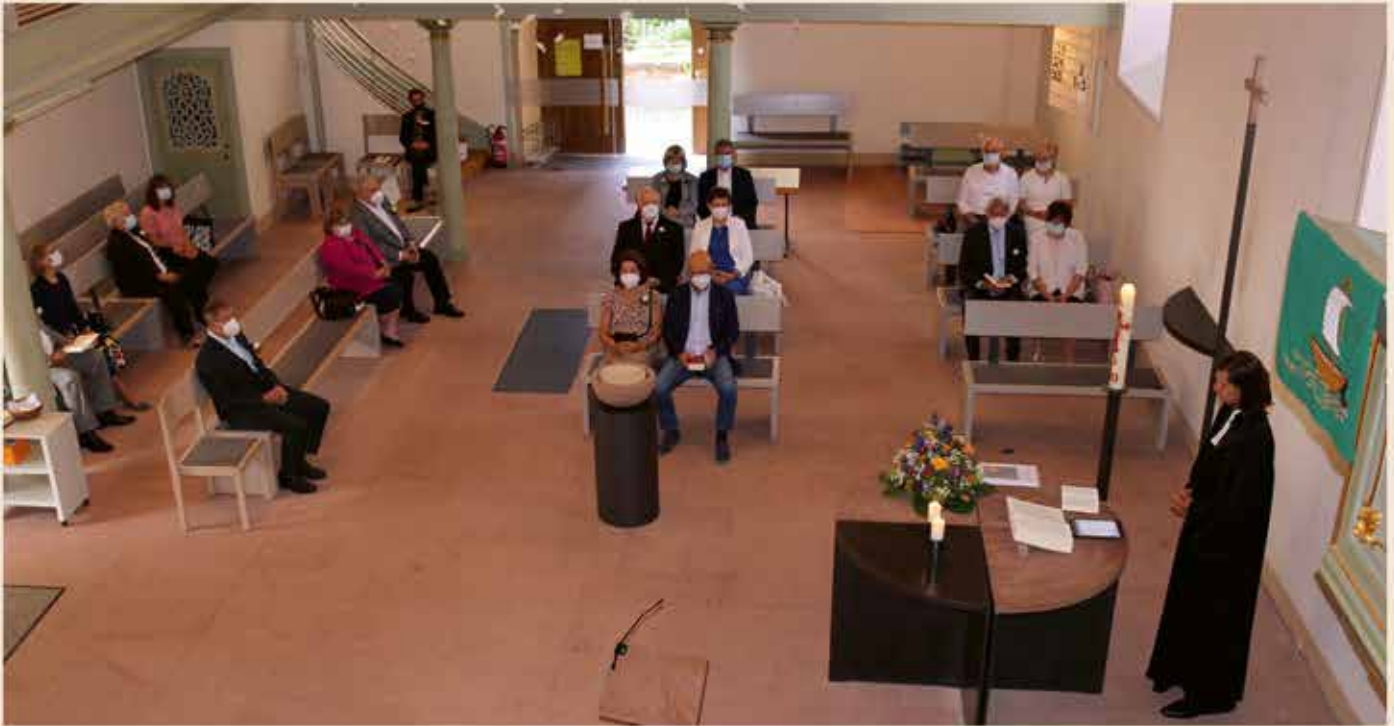
Goldene, diamantene und eiserne Jubilare im Gottesdienst