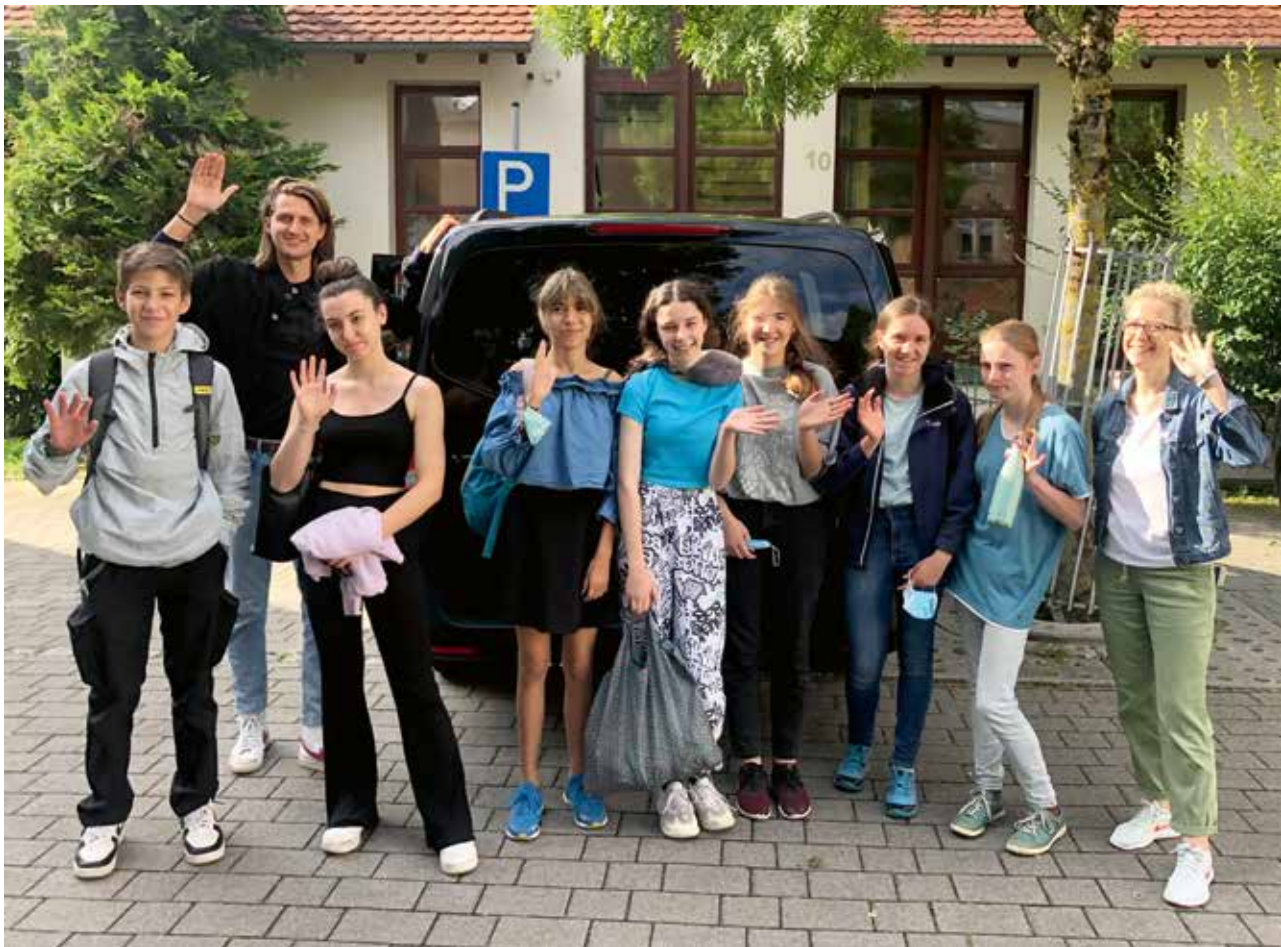
Start in eine spannende Reise

Tag 3: Um 8:30 Uhr gab es ein üppiges Frühstück. Punkt 9:15 Uhr fuhren wir ab nach Wittenberg in das ehemalige Kloster, wo Luther lebte. Wir besichtigten das Museum mit Originalgegenständen der damaligen Zeit z. B. eine Truhe, in der das Geld des Ablasshandels aufbewahrt wurde oder erste original Drucke der ins Deutsche übersetzten Bibel. Danach fertigten wir in einem Workshop die Lutherrose aus Ton. Anschließend haben wir die Stadtkirche besichtigt, in der