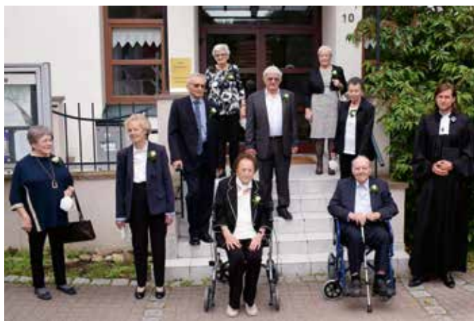
Gruppe 2

Damals und heute Vertrauen in die Zukunft – auf Gott. Spüren sie die Freiheit – oder auch die