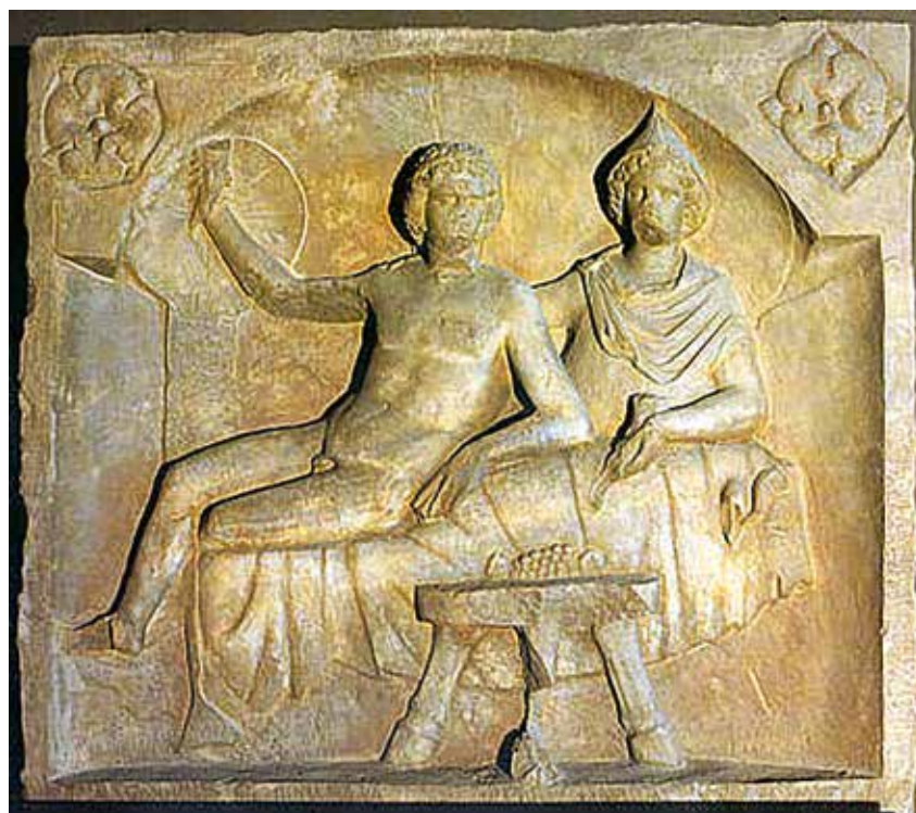
Das gemeinsame Mahl von Mithras und Sol. Kultbild aus dem Mithräum I Lopodonum-Ladenburg. (um 130 n. Chr., Kopie). Heidelberg, Kurpfälzisches Museum.

Nach dem Edikt von Mailand konnte Konstantin als römischer Kaiser die Christen unterstützen, ohne dass sich die Heiden benachteiligt fühlten, was sonst den Frieden im Reich hätte gefährden können.