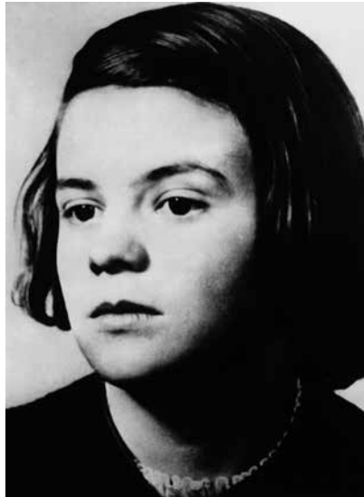
vor 100 Jahren wurde Sophie Scholl (undatiertes Archivfoto) geboren.

In Ulm traten die Geschwister gegen den Willen ihres Vaters der Hitlerjugend und dem Bund Deutscher Mädel bei, den Jugendorganisationen der Nationalsozialisten. Als Scharführerin liebte Sophie Mutproben und war gern draußen in der Natur. Aber sie konnte nicht verstehen, dass ihre jüdische Freundin davon ausgeschlossen wurde, obwohl