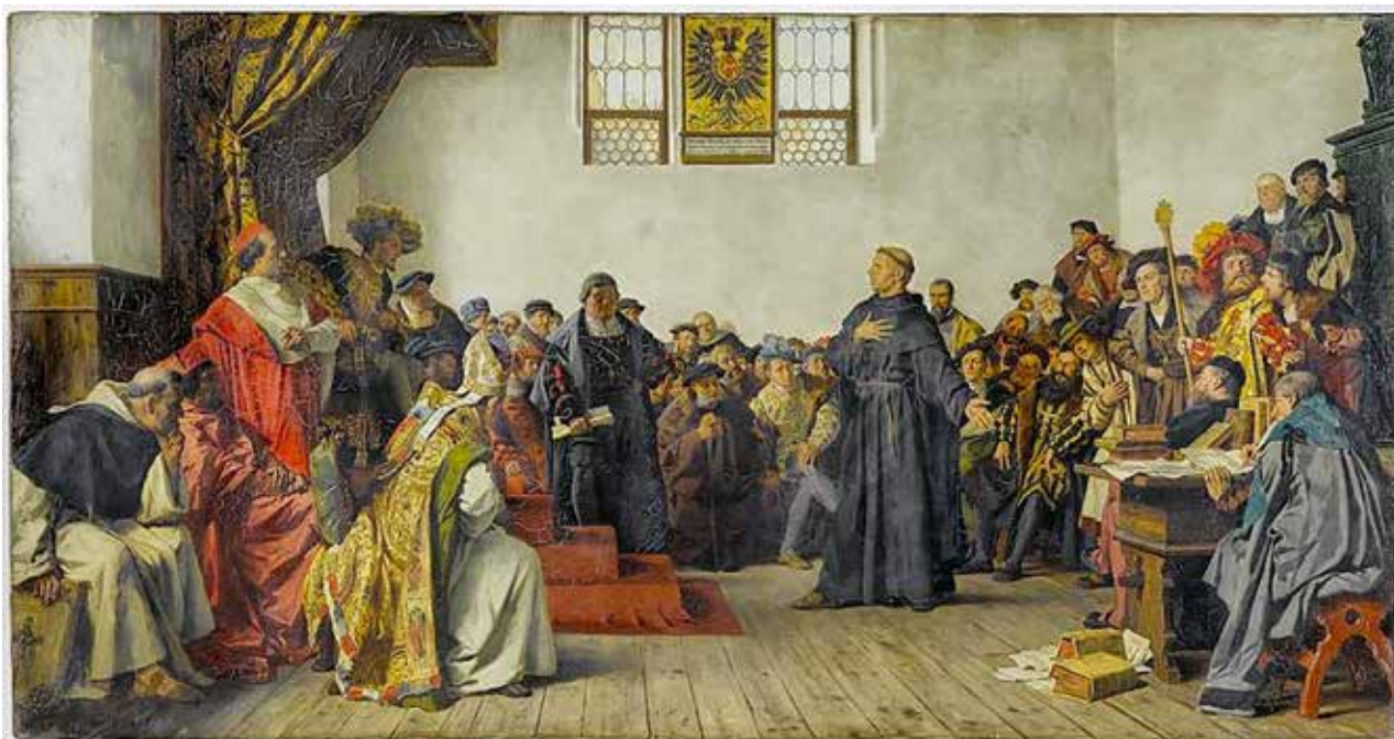
Luther vor dem Reichstag in Worms Anton von Werner 1877

Trompeten vom Turm des Domes kündigen am 16.4. Luthers Ankunft in Worms an. Sächsische Adelige vor den Toren und hunderte Menschen in den Straßen der Stadt bereiten ihm einen triumphalen Empfang. Im Johanniterhof muss er sich eine Schlafkammer mit zwei sächsischen Beamten teilen. Am nächsten Morgen erfährt er, dass er am Nachmittag um vier Uhr im Bischofshof am Dom zu erscheinen und seine Lehre zu rechtfertigen hat.