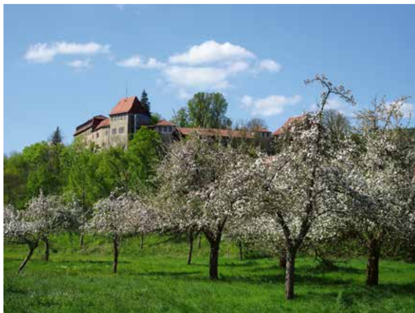
Die Burg Creuzburg

Vor 400 Jahren starb Michael Praetorius am 15. Februar 1621, an seinem 50. Geburtstag, in Wolfenbüttel. Dort ist er in der Marienkirche begraben.