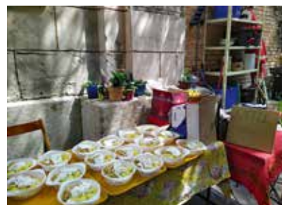
s'Häferl in Wien

In Europa brauchen beispielsweise in Spanien oder auch Kirgisistan sozialdiakonische Projekte unsere Hilfe, die sich der Ärmsten der Armen, d.h. der Obdachlosen annehmen. Und selbst in Österreich braucht „s'Häferl“, eine Anlaufstelle für Haftentlassene, Armutsbetroffene und Obdachlose, finanzielle Hilfe.