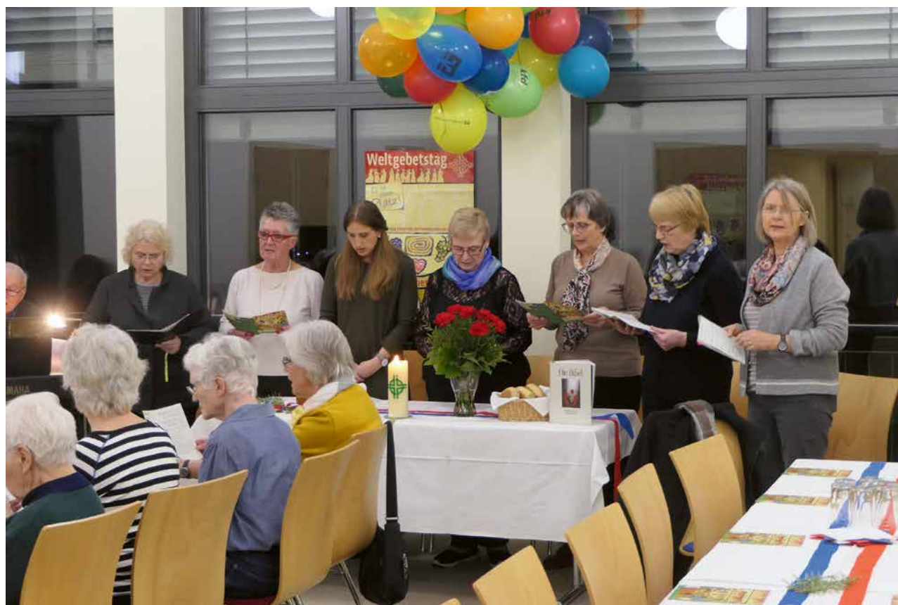
Die Damen des Großsachsener Organisationskomitees.

Auf dem Tisch stehen außer der Bibel und der Weltgebetsstags-Kerze landestypische Produkte aus Slowenien: Nelken, Rosmarin, Honig, Salz, Brot und Potica (Nusskranz) und bunte Bänder in den Landesfarben Weiß-Blau-Rot.