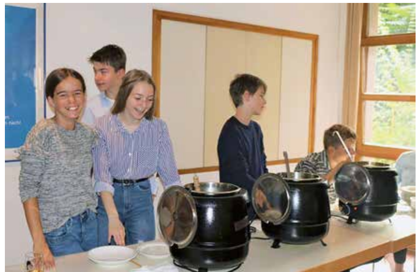
Fröhliche Konfirmanden mit dem von ihnen gekochten Eintopf

Im Rahmen des Gottesdienstes stellten sich nun ebenfalls „offiziell“ die 13 Konfirmanden