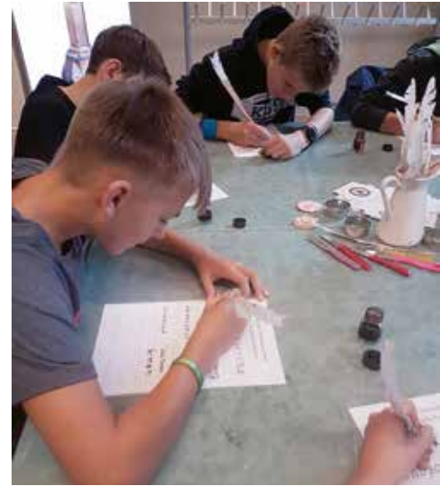
So schrieb auch Luther - mit Federkiel und Tinte.

Am letzten Tag hieß es Abschied nehmen und Koffer packen. Abschluss der Freizeit war der Gottesdienstbesuch in der Schlosskirche.