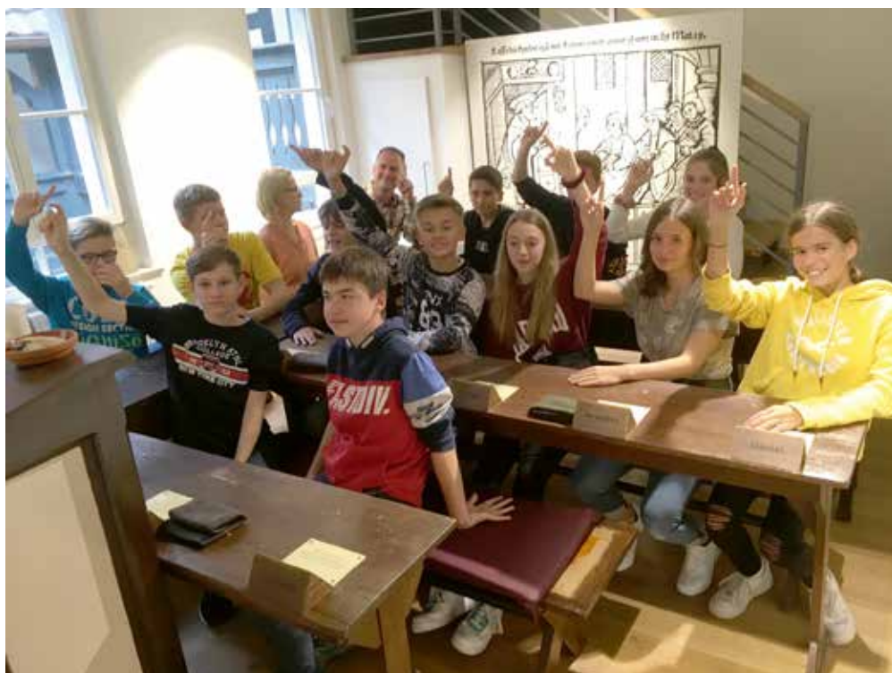
Im Klassenzimmer wie zu Luthers Zeiten