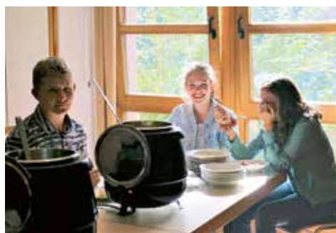
Konfirmanden beim Eintopf

Angeregte Gespräche, lebhafter Austausch aller Generationen und viele zufriedene Gesichter spiegelten den gelungenen Gottesdienst und das gemeinsame Miteinander beim Mittagessen wieder. Ein herzliches Dankeschön an alle emsigen Helfer!