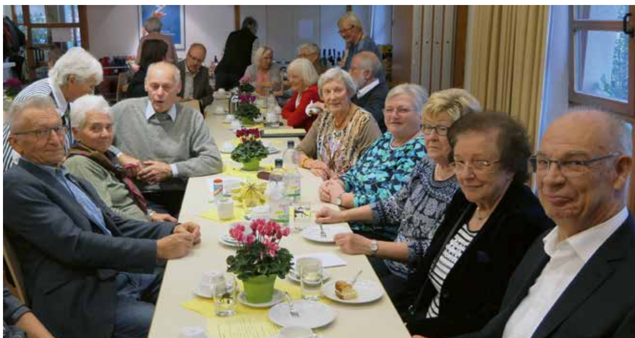
Aus Hohensachsen kamen etliche Freunde vom dortigen Kirchenchor